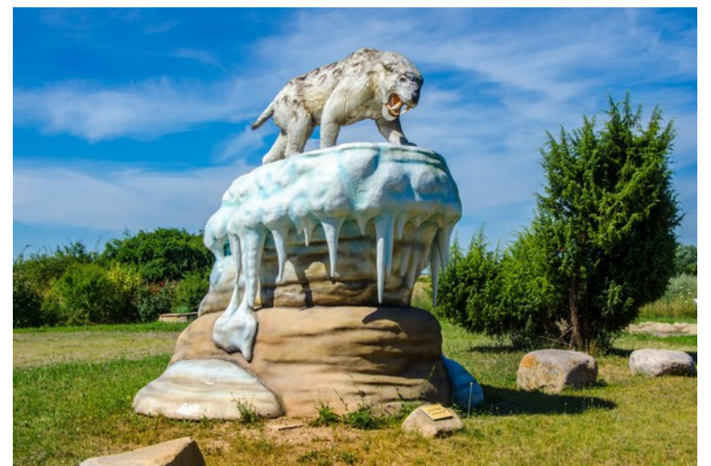
Säbelzahntiger vor dem Eiszeitmuseum

Weiter geht's nach Großziethen zum Besuch des Eiszeitmuseums. Von dort mit Bus und Bahn zurück nach Berlin.