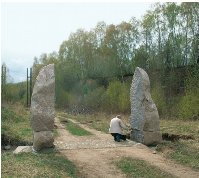
Granitfindlinge in der Steingrube Ihlowberge

Von dort wandern wir durch die eizeitlich geprägte „Lehrbuch“-Landschaft der Pommerschen Eisrandlage.