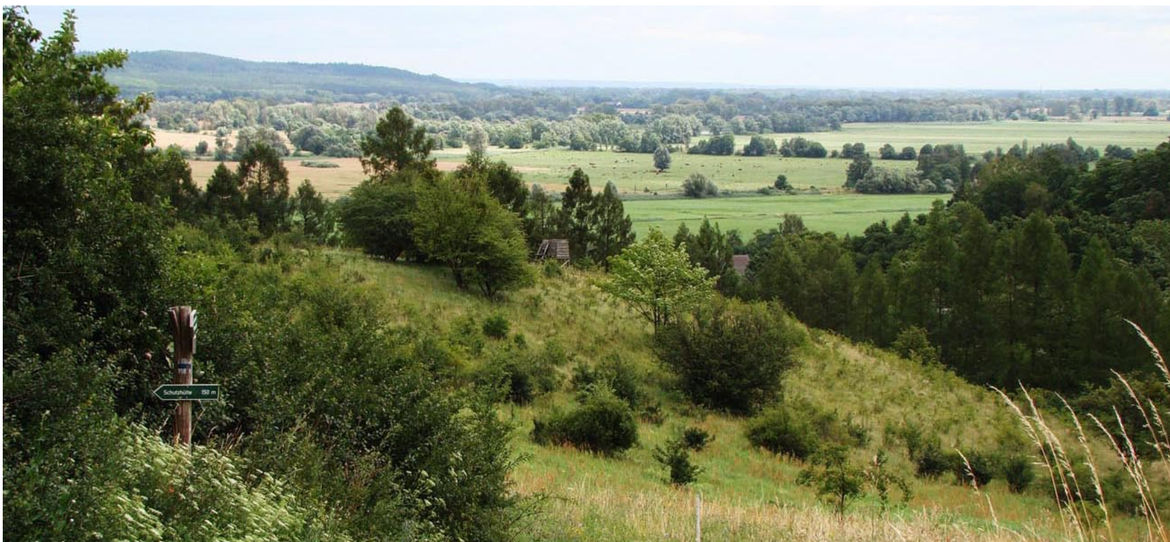
Die Landschaft des Oderbruch N' Bad Freienwalde