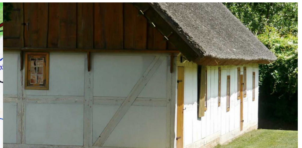
Fischerhaus im Oderbruchmuseum